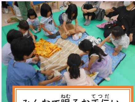
ねむ みんなで眠るお手伝い てっだ