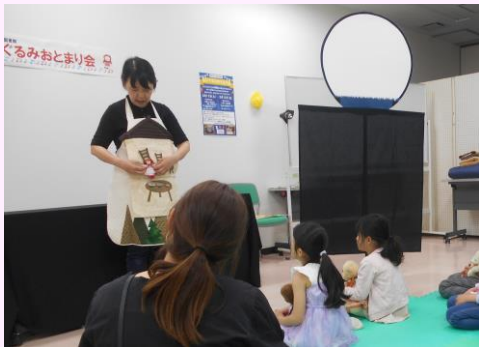
たの 楽しいおはなし会 かい