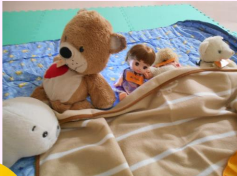
め 目が覚めちゃった！ さ