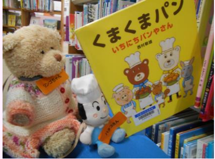
よる としょかん 夜の図書館で たくさんあそんだよ！