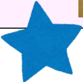
つぎ 次の日・・・ むかえに来てくれて、うれしいな き