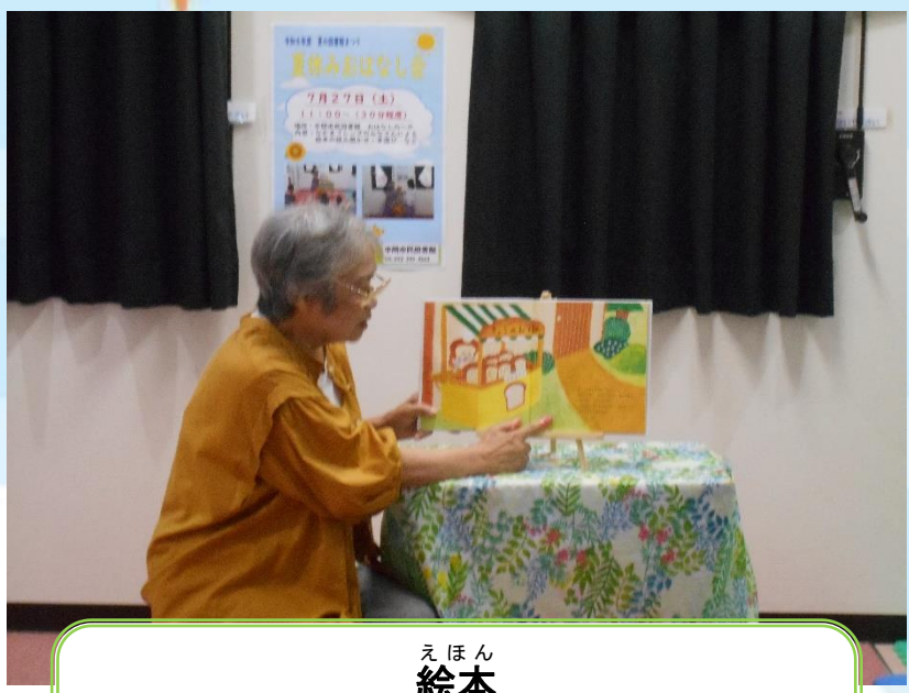
えほん 絵本 「パンどろぼう VS にせパンどろぼう」