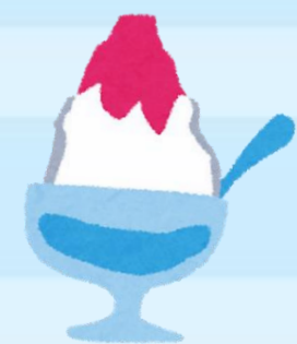
クイズ 「まちがいさがし」