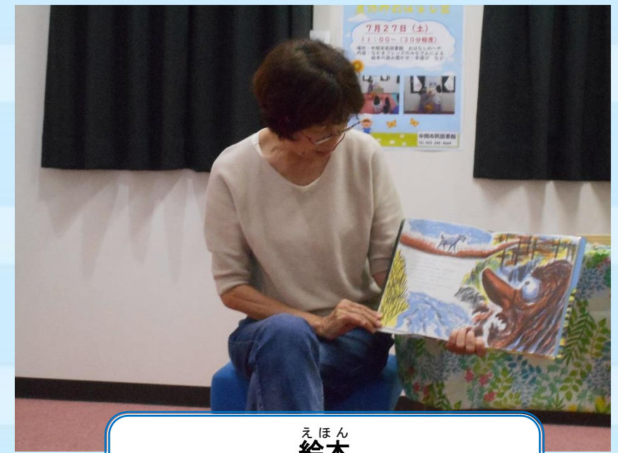
えほん 絵本 「三匹のやぎのがらがらどん」