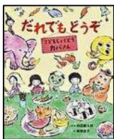
「だれでもどうぞ」 内田 麟太郎ぶん、南塚 直子え 童心社

できたばかりの「こどもしょくどう」。“だれでもどうぞ”と書かれた看板を見てやってきたのは、カバ! おばけたちにお年寄りも加わって、こどもしょくどうはおおにぎわい!?