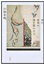
「外の世界の話聞かせて」 江國 香織著 集英社

外苑前の私設図書館、三重にある元公民館の空き家、斎場、夜の飲食店、インドネシアの農園…。時間と場所を超えて重なり、織り上げられてゆく人の生に静かに耳を傾ける群像劇。『すばる』連載に加筆・修正。